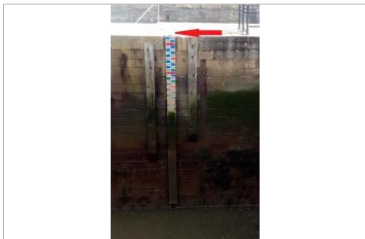
Echelle marégraphe aval de l'écluse du port de Morlaix

Altitude calculée de l'eau (en m) : 5.636 m