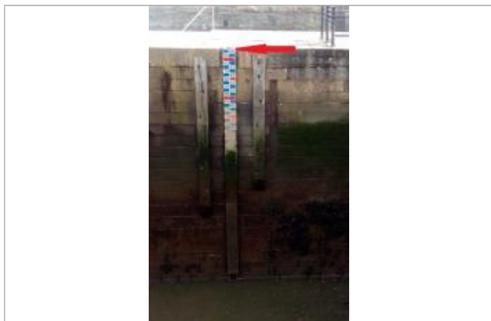
Echelle marégraphe aval de l'écluse du port de Morlaix

Altitude calculée de l'eau (en m) : 5.446 m