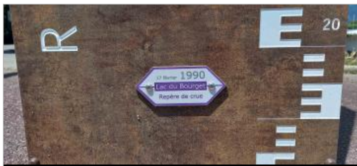
Repère de crue 17 février 1990