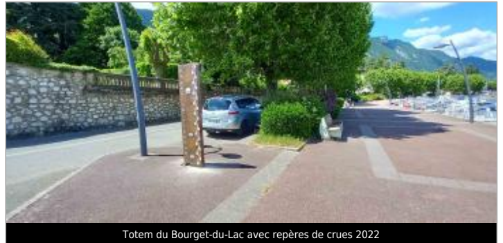
Totem du Bourget-du-Lac avec repères de crues 2022