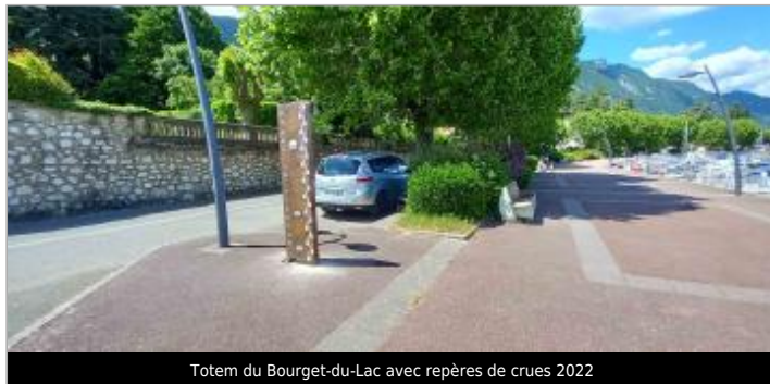
Totem du Bourget-du-Lac avec repères de crues 2022