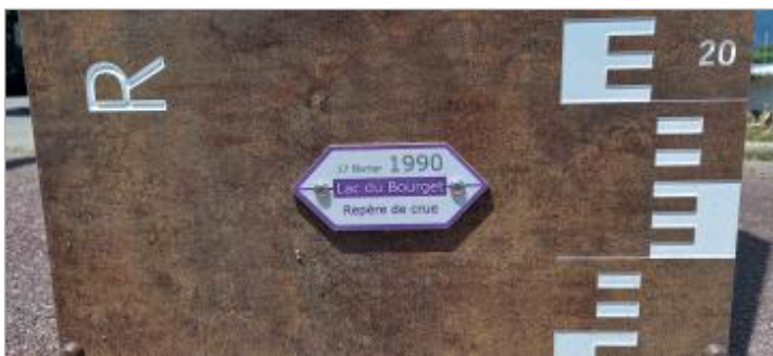
Repère de crue 17 février 1990