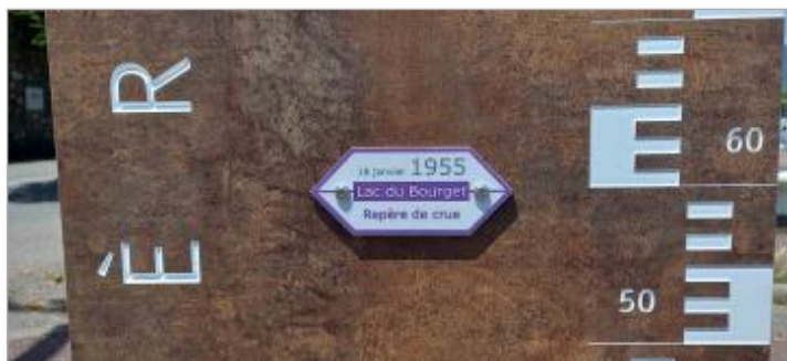
Repère de crue 18 janvier 1955