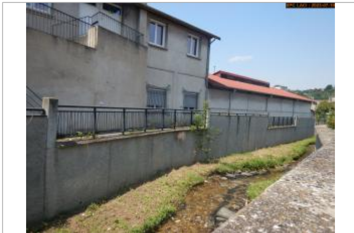
Vue du site en 2023 (1er repère)