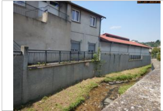
Vue du site en 2023 (1er repère)

Coordonnées WGS84 : X: 4.29679520 / Y: 45.39424100