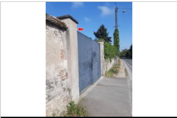
Vue du site en mai 2022

GÉOLOCALISATION Coordonnées WGS84 : X: 1.92179820 / Y: 47.87101800 Coordonnées RGF93 (Lambert 93) X: 619394.96 / Y: 6752841.83 Coordonnées RGF93 (ETRS89) : X: 1.9217982 / Y: 47.871018 Code Hydro: ----0000 Rive de référence: Gauche