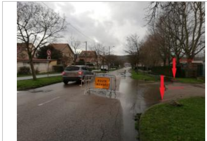
Vue depuis la rue Brossolette