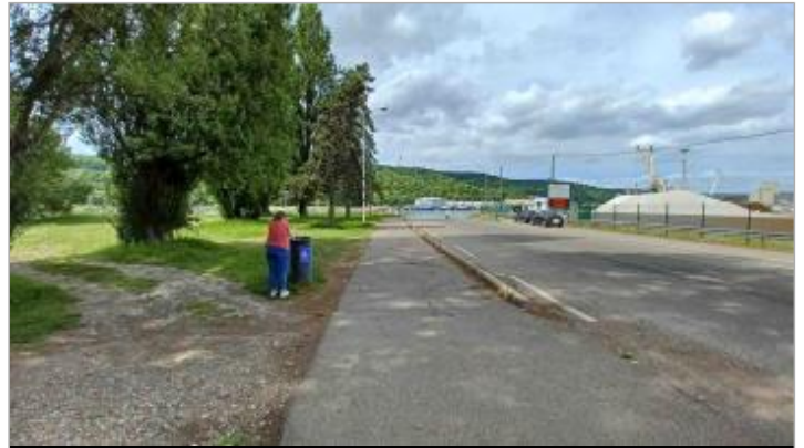
Sol herbeux, proche d'une poubelle, à proximité du départ du bac de Petit Couronne, Chemin du Pass d'Eau.

Coordonnées WGS84 : X: 1.01231640 / Y: 49.38501500