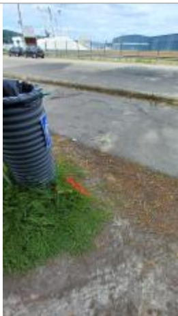
Laisse de crue sur sol herbeux

Altitude calculée de l'eau (en m) : 5.5 m