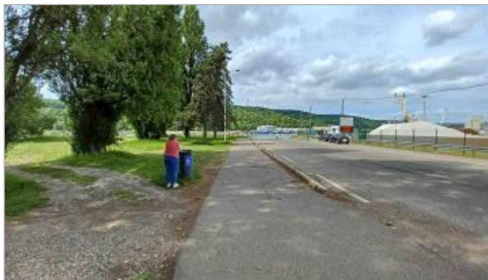
Sol herbeux, proche d'une poubelle, à proximité du départ du bac de Petit Couronne, Chemin du Pass d'Eau.

Coordonnées WGS84 : X: 1.01231640 / Y: 49.38501500