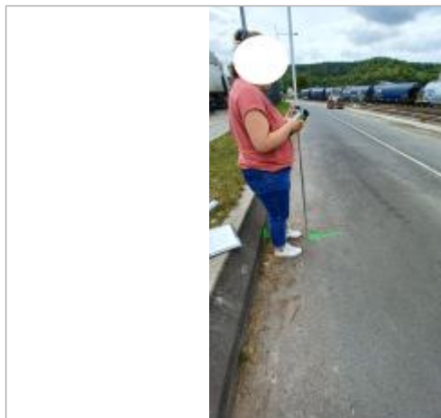
Laisse de crue au sol.

Altitude calculée de l'eau (en m) : 5.23