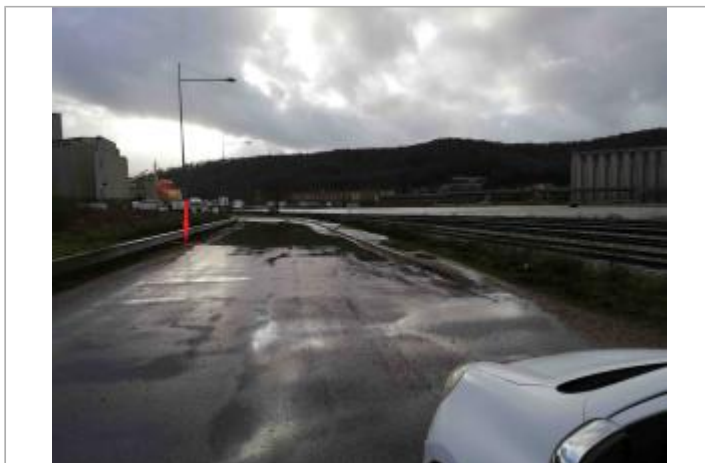
Sol de la chaussée bithumé, quai de petit Couronne.