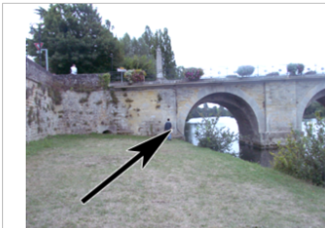
Vue du site BDHE 10013 point de repère 10027