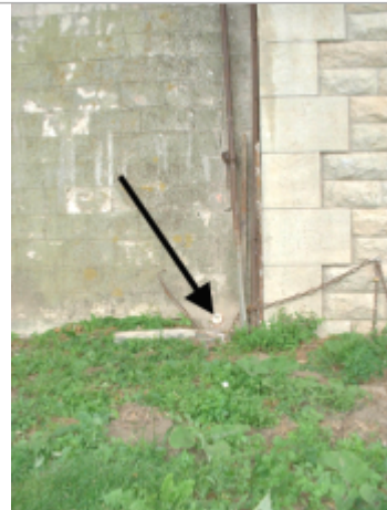
Vue du site BDHE 10010 point de repère 10019