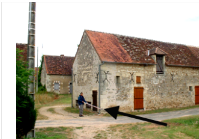
Vue du site BDHE 10004 point de repère 10008

Coordonnées WGS84 : X: 0.81393945 / Y: 46.81032764