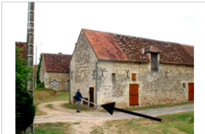
Vue du site BDHE 10004 point de repère 10008