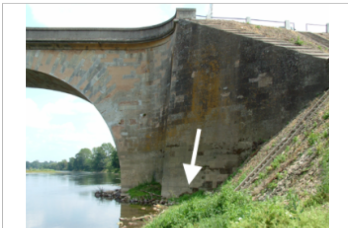
Vue du site BDHE 10019 point de repère 10035