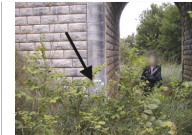
Vue du site BDHE 10018 point de repère 10033

Coordonnées WGS84 : X: 0.62082656 / Y: 46.99781800