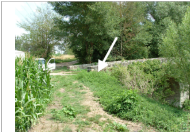
Vue du site BDHE 10017 point de repère 10031

Coordonnées WGS84 : X: 0.63298544 / Y: 46.98774574