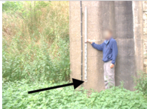
Vue du site BDHE 10011 point de repère 10022