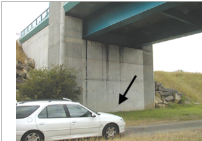
Vue du site BDHE 10003 point de repère 10005