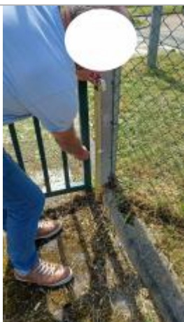
La laisse de crue sur le pilier se situe selon le témoignage à environ 40 cm/sol.

Altitude calculée de l'eau (en m) : 5.476 m