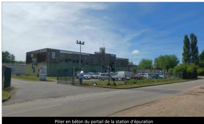
Pilier en béton du portail de la station d'épuration