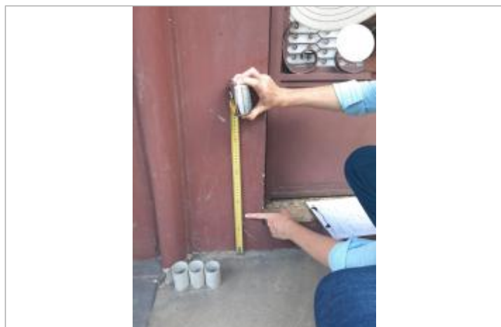
Quartier de l'assainissement - Rue Laurence Valmy

SOURCE DE REPÉRAGE : CAMPAGNE DE RELEVÉS TERRAIN DEAL 971 AVRIL 2022 - 30/04/2022