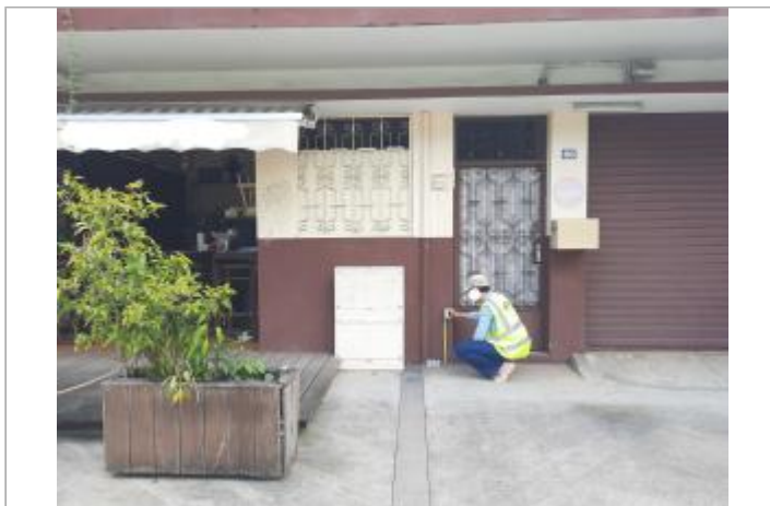
Quartier de l'assainissement - Rue Laurence Valmy