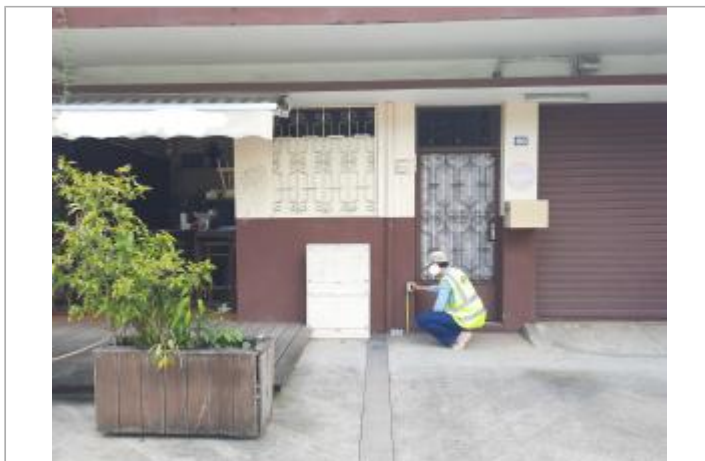
Quartier de l'assainissement - Rue Laurence Valmy