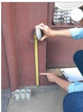
Quartier de l'assainissement - Rue Laurence Valmy

Altitude calculée de l'eau (en m) : 3.36