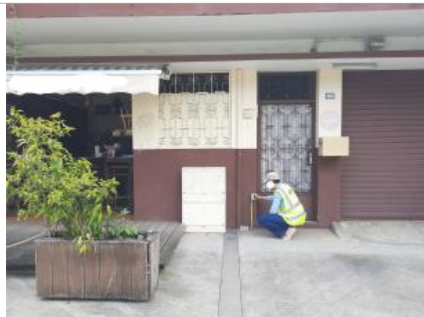
Quartier de l'assainissement - Rue Laurence Valmy

Coordonnées RGF93 (ETRS89) : X: -61.530537 / Y: 16.244307