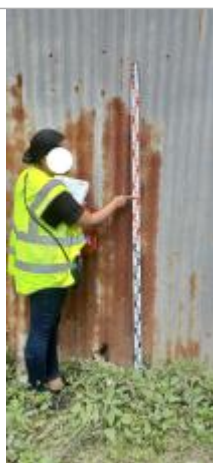
Niveau mesuré depuis le sol

Altitude calculée de l'eau (en m) : 2.94 m