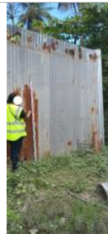
Vieux Bourg - Bord Canal Matelot #1