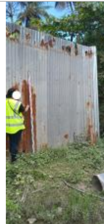
Vieux Bourg - Bord Canal Matelot #1

Coordonnées RGF93 (ETRS89) : X: -61.530974 / Y: 16.249695