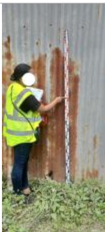
Niveau mesuré depuis le sol

Altitude calculée de l'eau (en m) : 2.94