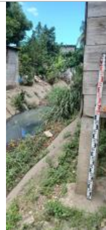
Vieux Bourg - Bord Canal Matelot #2

Coordonnées RGF93 (ETRS89) : X: -61.530554 / Y: 16.248877