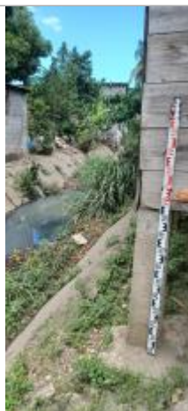
Vieux Bourg - Bord Canal Matelot #2

Altitude calculée de l'eau (en m) : 3.14 m