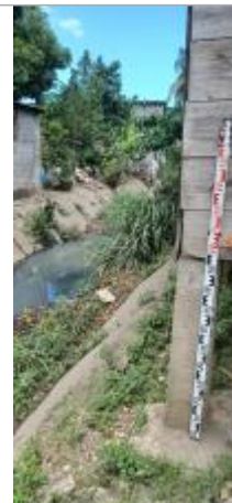
Vieux Bourg - Bord Canal Matelot #2