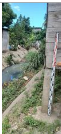
Vieux Bourg - Bord Canal Matelot #2

Altitude calculée de l'eau (en m) : 3.14