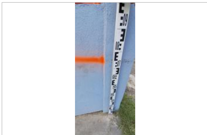
Niveau mesuré depuis le sol béton

Altitude calculée de l'eau (en m) : 2.85 m