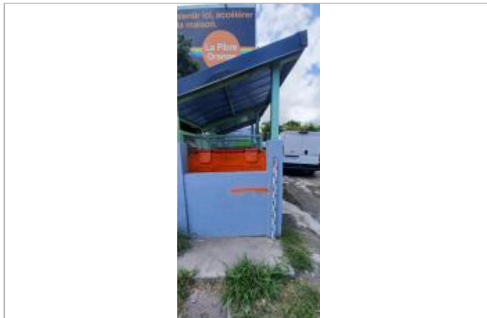
Residence Mortenol Nord - Local poubelle