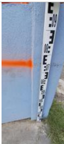
Niveau mesuré depuis le sol béton

Altitude calculée de l'eau (en m) : 2.85