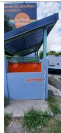
Residence Mortenol Nord - Local poubelle