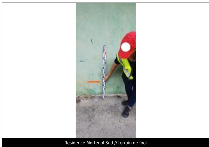
Residence Mortenol Sud // terrain de foot

Altitude calculée de l'eau (en m) : 2.83 m