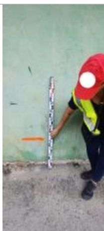
Residence Mortenol Sud // terrain de foot

Altitude calculée de l'eau (en m) : 2.83