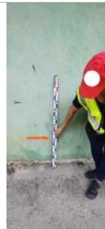
Residence Mortenol Sud // terrain de foot