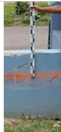
Residence Mortenol Sud - Local poubelle

Coordonnées RGF93 (ETRS89) : X: -61.531352 / Y: 16.240586