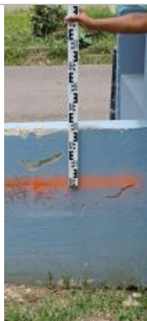
Niveau mesuré depuis le rebord de haut en bas

Altitude calculée de l'eau (en m) : 2.56 m