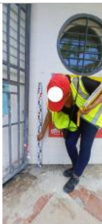
Société HLM, siege residence Vatable

Altitude calculée de l'eau (en m) : 2.96 m