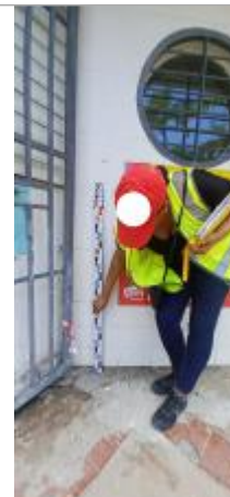
Société HLM, siege residence Vatable

Coordonnées RGF93 (ETRS89) : X: -61.531166 / Y: 16.23977