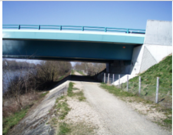
Vue du site BDHE 6311 point de repère 6240

Coordonnées WGS84 : X: 3.19772455 / Y: 46.97619783