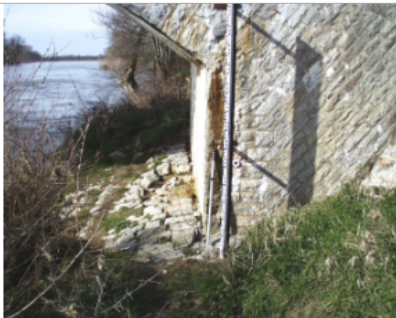
Vue du site BDHE 6093 point de repère 6102