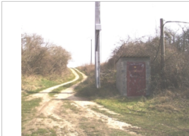
Vue du site BDHE 6077 point de repère 6210

Coordonnées WGS84 : X: 3.73810162 / Y: 46.59151998