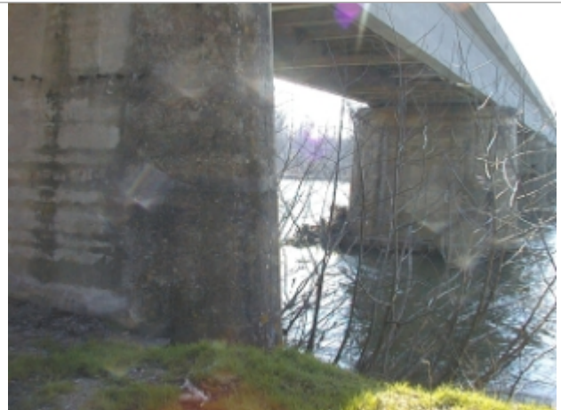
Vue du site BDHE 6072 point de repère 6207

Coordonnées WGS84 : X: 3.76047293 / Y: 46.53887558