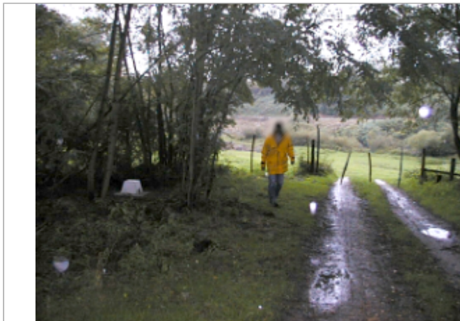
Vue du site BDHE 6057 point de repère 6198

Coordonnées WGS84 : X: 3.91933570 / Y: 46.49538559