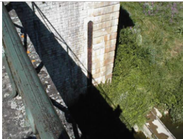
Vue du site BDHE 6050 point de repère 6055