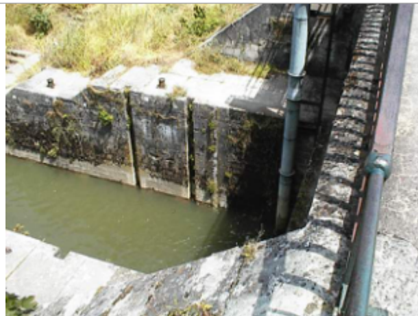
Vue du site BDHE 6140 point de repère 6242