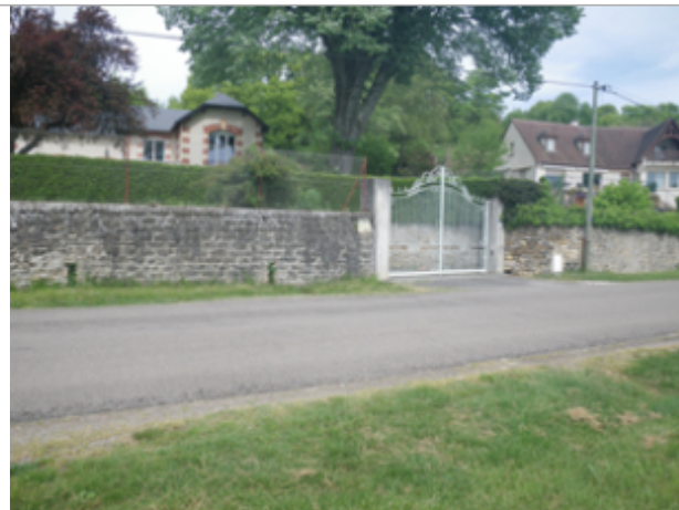
Vue du site BDHE 6149 point de repère 6246