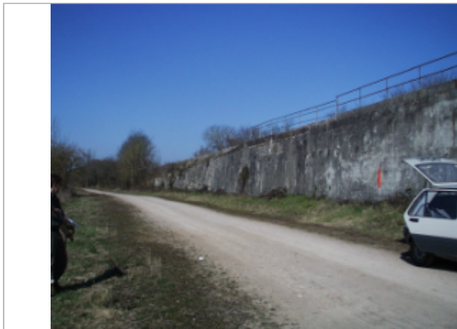
Vue du site BDHE 6136 point de repère 6238