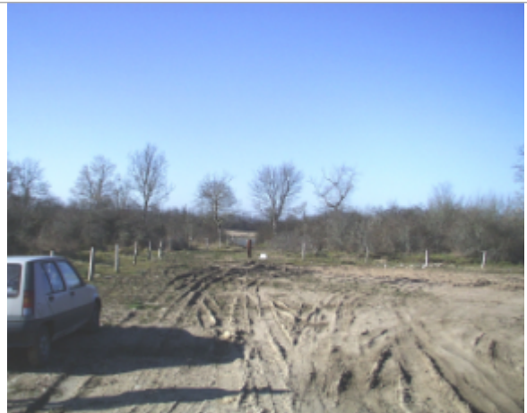
Vue du site BDHE 6123 point de repère 6234 (source: DIREN Centre)

Coordonnées WGS84 : X: 3.28849352 / Y: 46.87570580