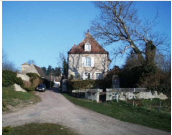
Vue du site BDHE 6114 point de repère 6230

Coordonnées WGS84 : X: 3.39207499 / Y: 46.83187486