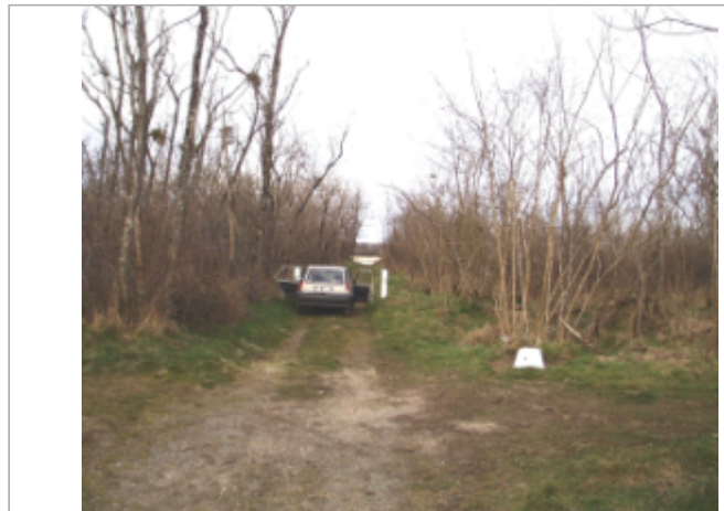
Vue du site BDHE 6099 point de repère 6226 (source: DIREN Centre)

Coordonnées WGS84 : X: 3.57127002 / Y: 46.77402936