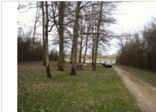
Vue du site BDHE 6097 point de repère 6225