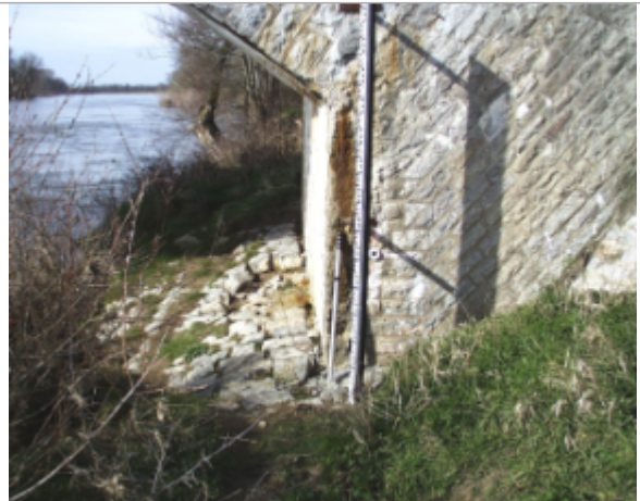
Vue du site BDHE 6093 point de repère 6102

Coordonnées WGS84 : X: 3.63925909 / Y: 46.73144104