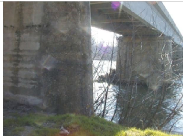
Vue du site BDHE 6072 point de repère 6207