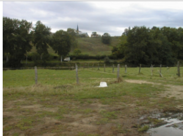
Vue du site BDHE 6308 point de repère 6190