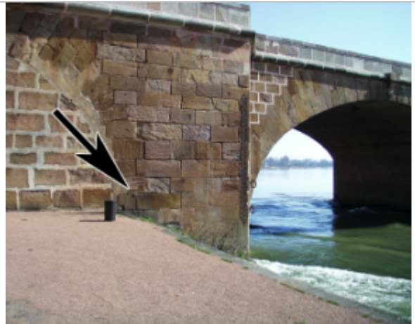
Vue du site BDHE 6142 point de repère 6156

Coordonnées WGS84 : X: 3.15775998 / Y: 46.98476767