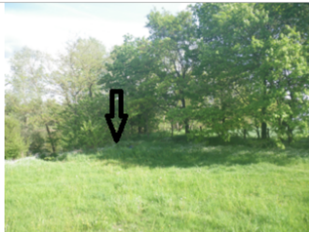
Vue du site BDHE 6091 point de repère 6218